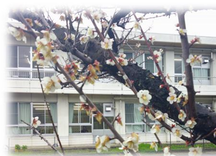
白梅がひっそりと咲いています

今 別れの時 飛び立とう 未来信じて はずむ 若い力 信じて この広い この広い 大空に